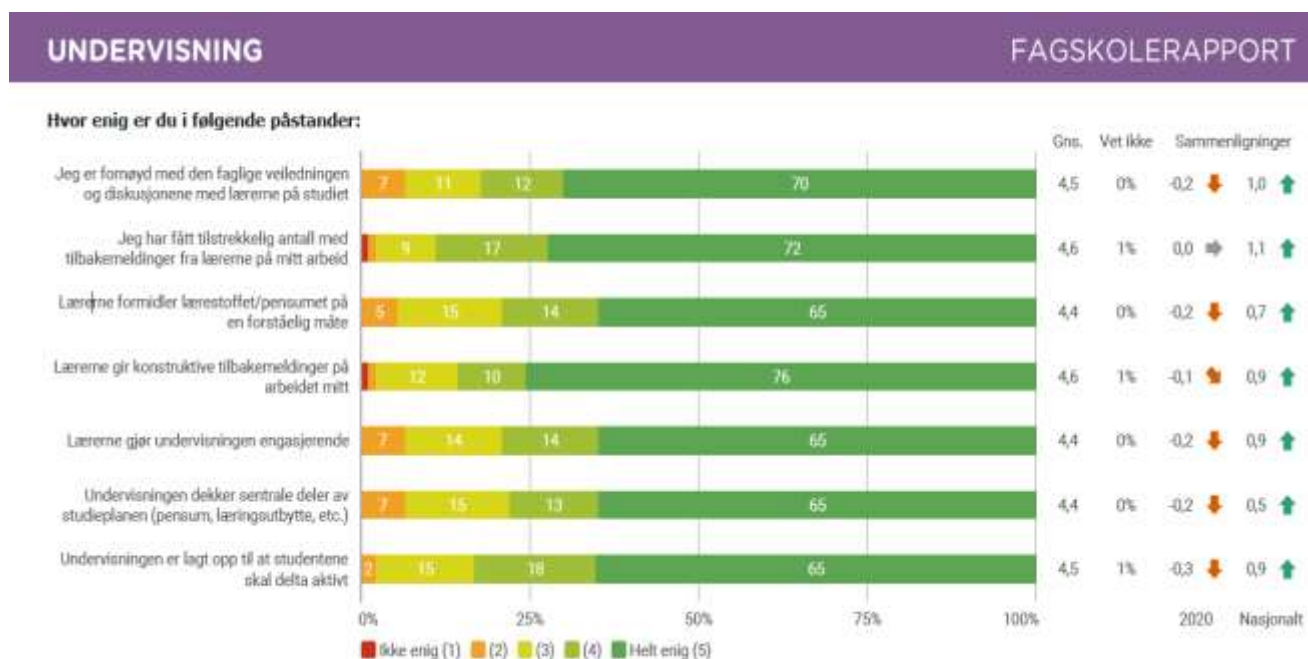
Tabell 6: Fra rapport Undervisning i Studiebarometeret 2021. Fagskolen Aldring og helse