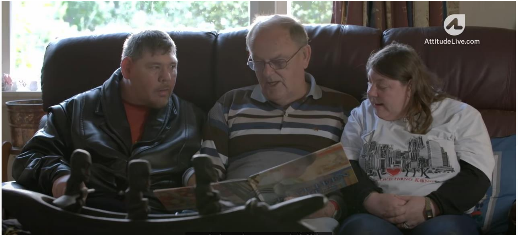
Parenting kids with disabilities https://www.youtube.com/watch?v=SHuTSv6-oeE