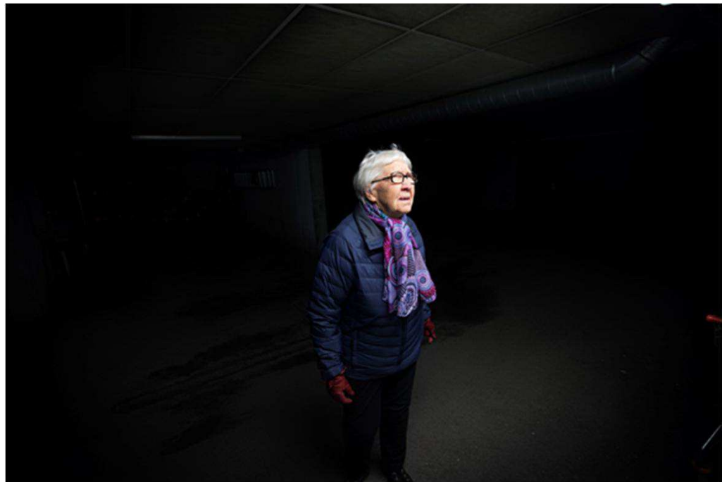
Aldring og helse: Foto Martin Lundsvoll

Resultatene viste at MADRS hadde god evne til å skille eldre personer med og uten depresjon.