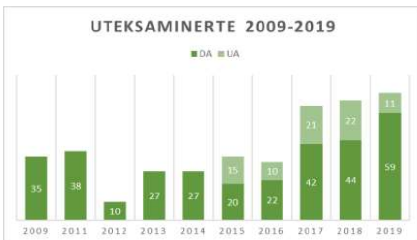
Tabell 1: Uteksaminerte 2009-2019

Søylene i tabell 1 viser økningen av antall uteksaminerte i perioden 2009 – 2019. I denne tiårsperioden er det uteksaminert 403 med etterspurt spisskompetanse i landets kommuner. Det er 324 helsefagarbeidere som har fått spisskompetanse i Demensomsorg og alderspsykiatri (DA) og 79 som har spisskompetanse i Utviklingshemning og aldring.